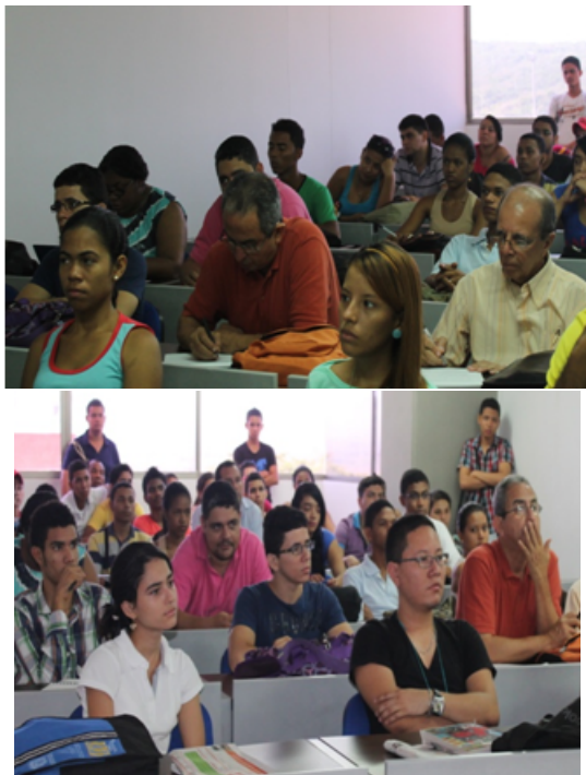
Asistentes al evento

El evento fue inaugurado por la Conferencia sobre Una visión crítica de la investigación en Educación Matemática, desde la óptica de la problemática latinoamericana , a cargo del Dr. Walter Beyer , U. Nacional Abierta-IPC, Venezuela, un espacio donde se debatió y compartió el desarrollo de la investigación matemática visto desde varios puntos de vista. Dentro de la amplia lista de 19 cursos desarrollados durante el evento destacamos [4]: