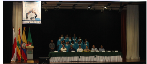
Apertura oficial de la Emalca

En el marco académico de este año, gracias a la colaboración del Centro Internacional de Matemáticas Puras y Aplicadas (CIMPA) y a la Unión Matemática de América Latina y el Caribe (UMALCA), la EMALCA Colombia 2013 se realizó en las instalaciones de la Universidad del Atlántico, en la ciudad de Barranquilla del 12 al 24 de agosto, cuya apertura oficial tuvo lugar en el teatro José Consuegra Higgins de la universidad Simón Bolívar [1].