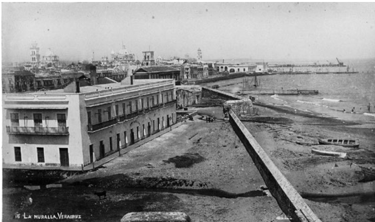
Imagen 5 “La muralla, Veracruz”

Fuente: Anónimo, último tercio del siglo XIX, Paul Getty Museum