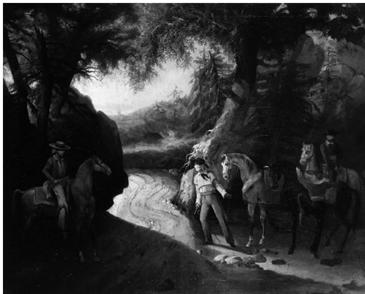
Imagen 1 “Asaltantes de caminos”

Fuente: Anónimo, siglo XIX, Museo Nacional del Virreinato. Reproducción autorizada por el Instituto Nacional de Antropología e Historia