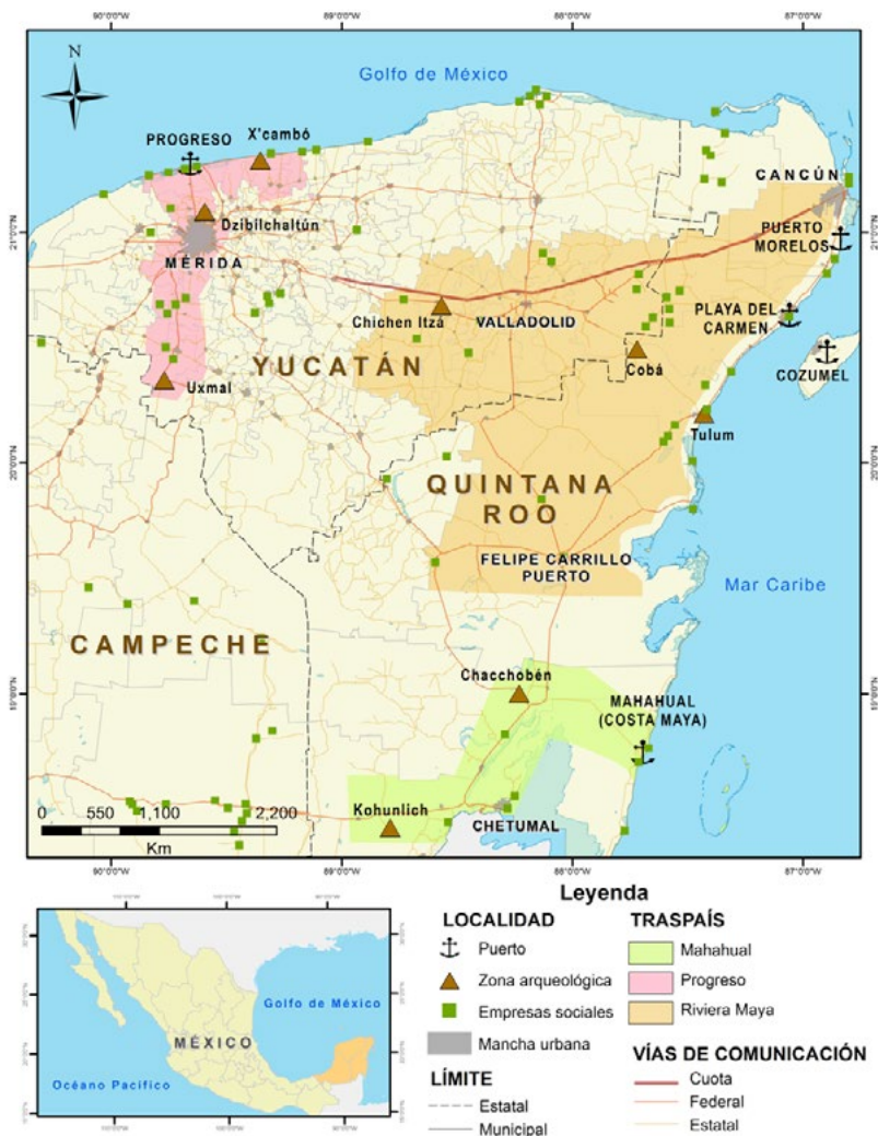
Figura 3 Los traspáis de la Península de Yucatán

Realización: Alejandro Montañez Giustinianovic.