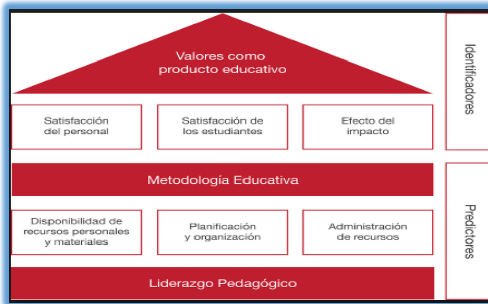
Figura 3: Modelo de Calidad Total para las Instituciones Educativas de Gento Palacios. Fuente: Gento Palacios (2002)

Se destaca lo expuesto por Gento, (2002:243) al afirmar que la “evaluación será un elemento potenciador del replanteamiento constante de todo el proyecto en sus diferentes fases”.