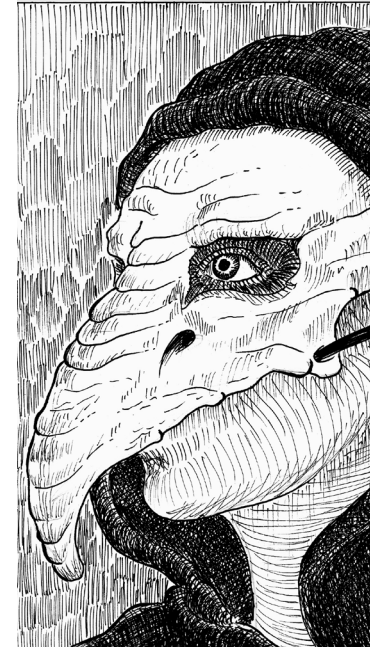
Dibujo. Daniel De la Hoz