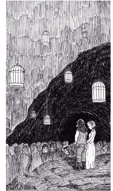
Dibujo. Daniel De la Hoz

Los demonios salen, quedando ELLA sola en escena.