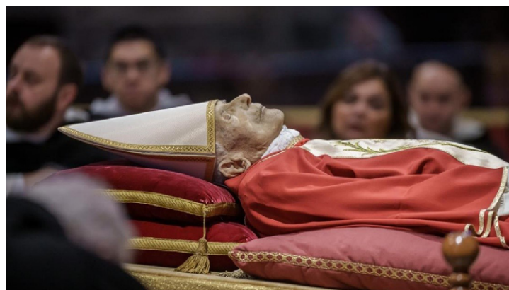
Figura 4. El féretro de Benedicto XVI en el Vaticano

Nota. Michael Kappeler / dpa - Europa Press (2023).