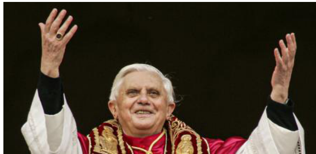
Figura 1. El nuevo santo padre saluda tras su elección

Nota. Tras casi 27 años del tercer pontificado más largo en la historia de la Iglesia católica del gran Juan Pablo II, en el segundo día del cónclave de 2005 se elige al Cardenal alemán Ratzinger como nuevo Obispo de Roma, quien saluda desde el balcón tras el anuncio del protodiácono.