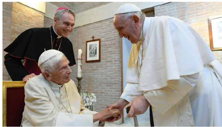
Figura 3. Los dos Papas

Nota. Era habitual que el Papa Francisco visitara al emérito con los cardenales recién nombrados en consistorios. El País (2022).