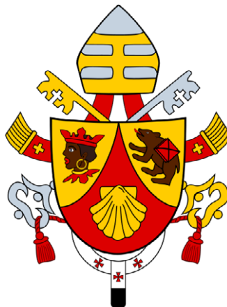
Figura 2. Cooperatores veritatis

Nota. Representa el escudo del pontificado de Benedicto XVI. Fuente: VA (2005).